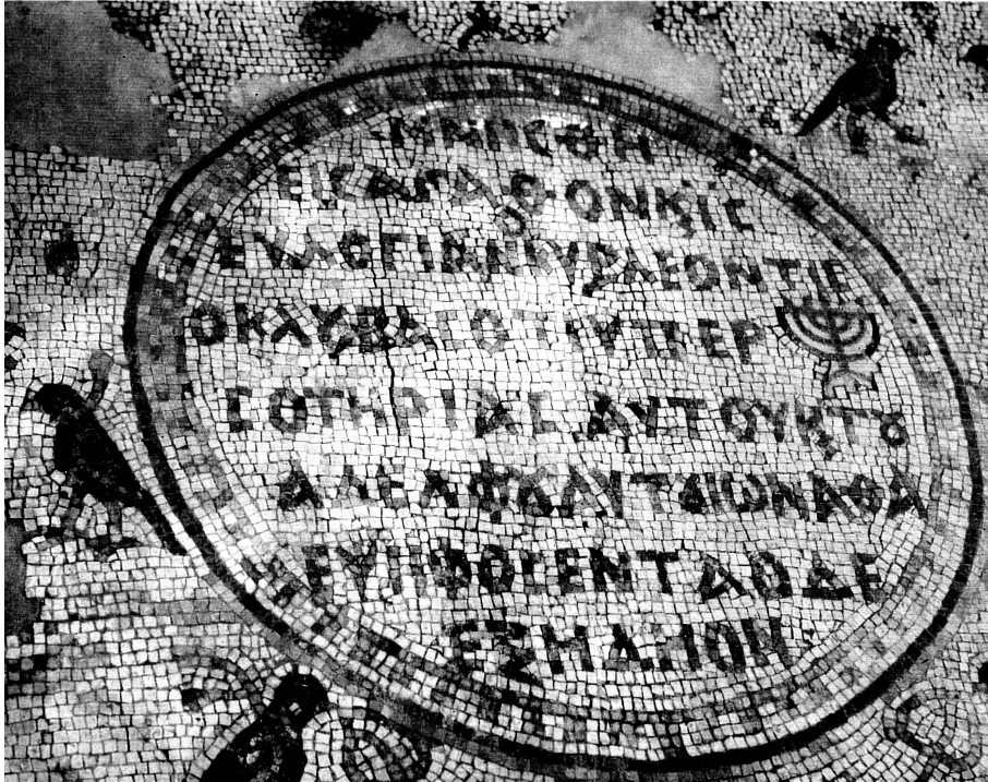
Abb.: Die Inschrift des Leontios

Μνησθῆ εἰς ἀγαθὸν κ(αι) (ε)ἰς εὐλογίαν ὁ κύρ(ιος) Λεόντις ὁ κλουβᾶς ὅτι ὑπὲρ 5 σοτηρίας [sic] αὐτοῦ κ(αι) τοῦ ἀδελφοῦ αὐτοῦ Ἰωναθᾶ ἐψήφοσεν τὰ ὄδε ἐξ ἡδῆον 21 .