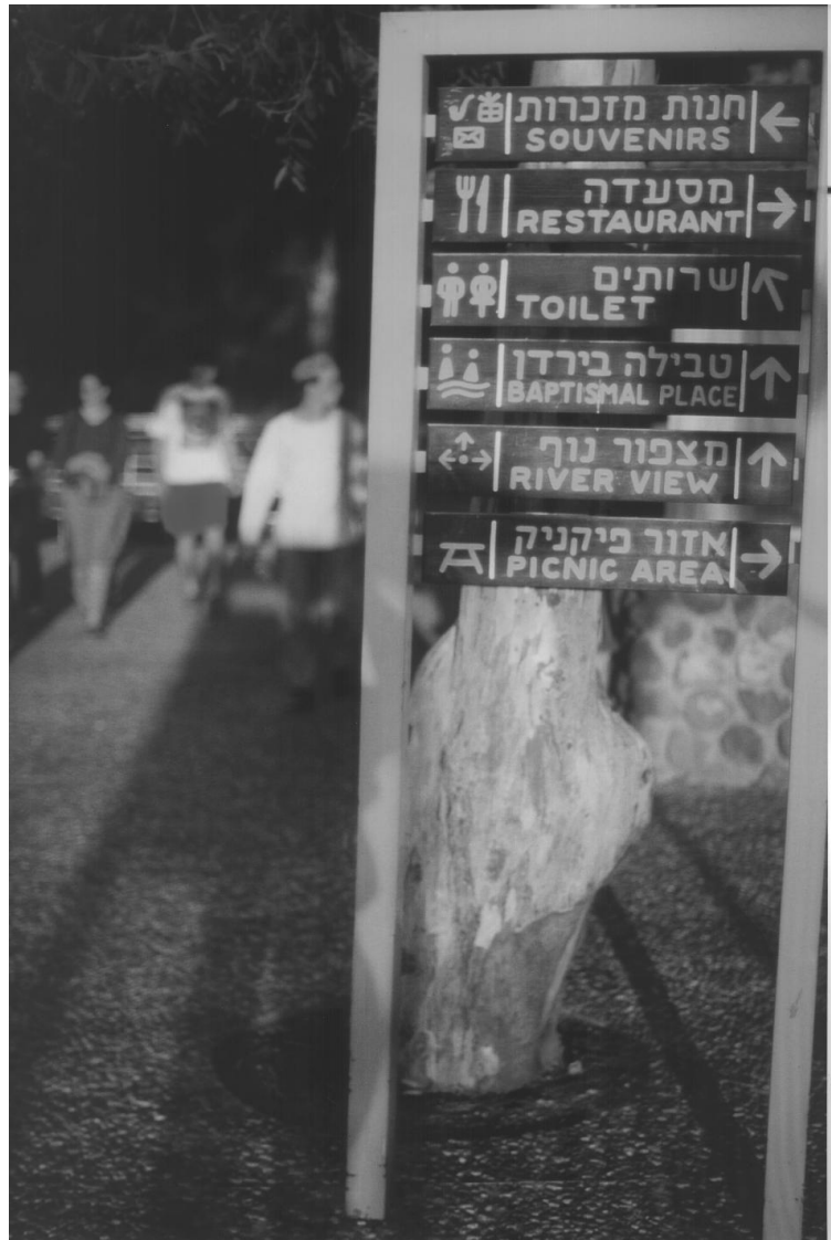
Abb.: Infrastruktur eines holy place

Auf der Rückfahrt nach Tiberias amüsierte sich die historisch-kritisch geschulte Gruppe über eine Jordanstelle, die von vielen Souvenirläden als Taufstelle Jesu verkauft wurde. Der dortige Rummel verkürzte den Zwischenstop, und die Heimfahrt endete rechtzeitig vor dem Abendbrot.