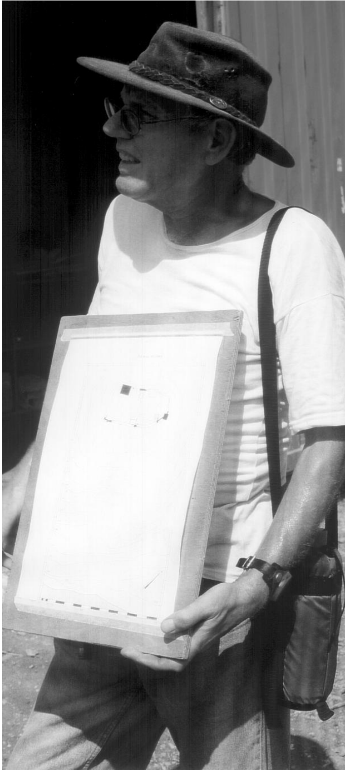
Abb.: Auf einem Tell gibt es keinen Schatten...