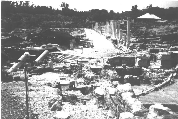
Abb.: Skythopolis von oben.

dern (wenngleich leider nicht photographieren!). 7